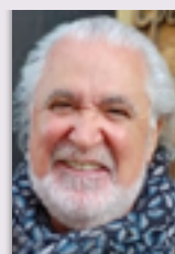
Por Víctor Martín Martínez

tiene un sentido literal, es decir, que se puede cuantificar en euros, y también otro figurado: de hartazgo, de fatiga, de cansancio. No obstante, y para que nadie piense que no soy moderno, les deseo de corazón una feliz Navidad y un próspero año 2024.