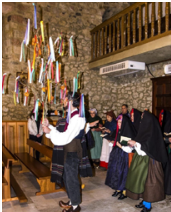
El grupo Alto Pisuerga cantando el ramo

en sus modos más arcaicos. Nuevamente se trata de una composición que parte de una melodía base y varía la letra.