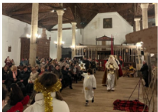
Pastorada en Cisneros 2023

El villancico se convirtió en el canto estrella de la navidad, por lo que encontramos numerosos ejemplos a lo largo de nuestra provincia. Es curioso encontrar en ellos vocablos que rezuman