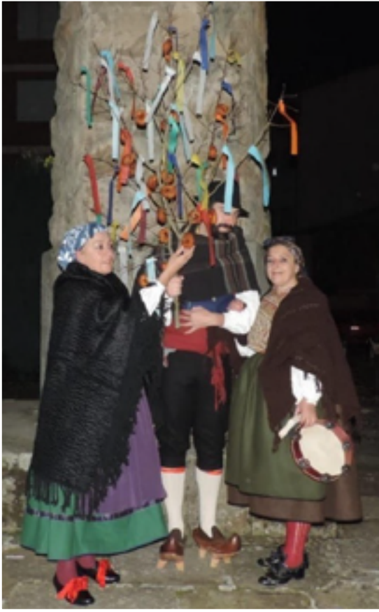
Ramos de encintados y rosquillas

Los tradicionales romances o cantos narrativos de la tradición oral también recogen estampas del nacimiento de Jesús. Fueron muy populares El milagro de la Virgen y el ciego, y El niño perdido: