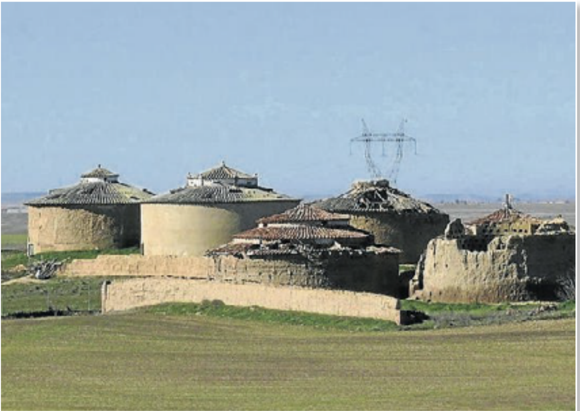
Palomares en los alrededores de Torremormojón.

Asimismo, se trata de un material que ni se incendia, ni se pudre, ni es susceptible de recibir ataques de insectos. Al ser poroso aísla el sonido y es una materia ampliamente disponible en el planeta, adaptable y versátil. Sus emisores de dióxido de carbono son prácticamente inexistentes, respetuosa con el medio ambiente y, sobre todo, confortable para quienes habitan estas edificaciones ya que posee una gran capacidad para almacenar el calor. Resulta adecuada para climas con oscilaciones térmicas entre el día y la noche como es el caso de Castilla y León.