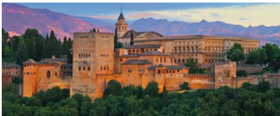
Alhambra de Granada, Se edificó hace más de 600 años y una gran parte de sus muros están contruidos con tierra,