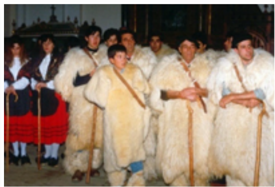
Terradillos de Campos